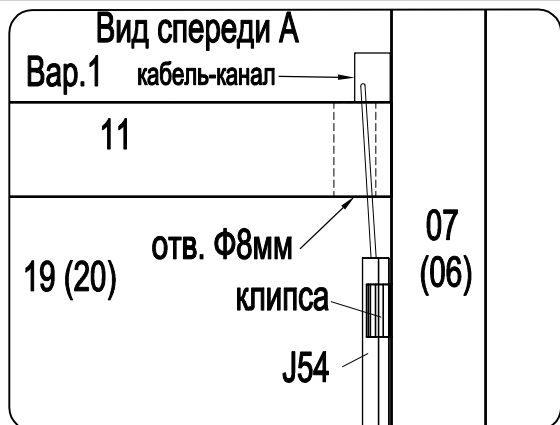
Схема крепления клипс